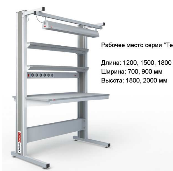
Рабочее место серии "Техно"

Длина: 1200, 1500, 1800 мм Ширина: 700, 900 мм Высота: 1800, 2000 мм