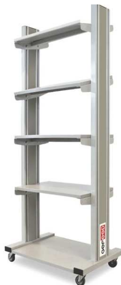
Стойка подкатная серии "Техно"

Длина: 1200, 1500, 1800 мм Ширина: 700, 900 мм Высота: 1800, 2000 мм